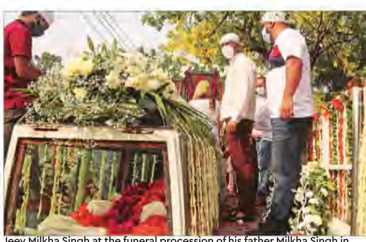
Jeev Milkha Singh at the funeral procession of his father Milkha Singh in Chandigarh on Saturday