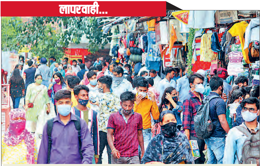
राजधानी दिल्ली में कोरोना महामारी के दौरान कोरोना के मामलों में आई कमी। लेकिन देशभर में कोरोना की तीसरी लहर के आने की संभावना है। इसके बावजूद लोग बाजारों में लापरवाही बरतने से बाज नहीं आ रहे हैं। शनिवार को चांदनी चौक मार्केट में खरीदारी के दौरान समाजिक दूरी का नहीं रख रहे ध्यान।