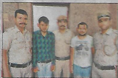
हरिभूमि न्यूज ► नई दिल्ली

सब्जी मंडी पुलिस ने एक ऐसे गैंग का पर्दाफाश किया है जोकि जॉब दिलाने के बहाने लोगों के साथ ठगी करता था। पुलिस ने इस गैंग में एक महिला समेत तीन लोगों को गिरफ्तार किया है जबकि एक नाबालिग को हिरसात लेकर पूछताछ कर रही है। पुलिस अधिकारी की माने तो आरोपी कभी मसाज सेंटर, तो कभी दवाई भेजने के नाम पर, तो कभी जन्मपत्री और कभी धार्मिक सामग्री भेजने के नाम पर लोगों से ठगी